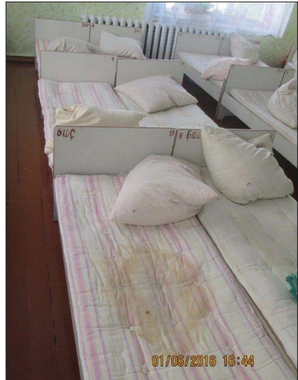
De oude matrasjes

Gelukkig hebben wij het afgelopen jaar weer mogen ervaren dat er ook in Nederland veel mensen zijn die onze stichting een warm hart toedragen. Heel veel dank hiervoor! Wij zijn blij met elke euro, want vele kleintjes maken immers één groot. Toch willen wij Kiwanis Dommeland te Valkenswaard en het Parochieel Missie Comité te Aalst, speciaal bedanken voor hun donatie. Het verstrekken van een maandelijks voedselpakket, schooluniformen en schoolgeld voor een aantal kinderen konden wij door deze donaties toezeggen. Ook kon de school een aantal nieuwe matrasjes aanschaffen voor de kinderbedjes, de allerkleinsten gaan 's middags nog naar bed. De matrasjes waren al lang aan vervanging toe, maar voor het schoolbestuur is het steeds een wikken en wegen wat het belangrijkste is.