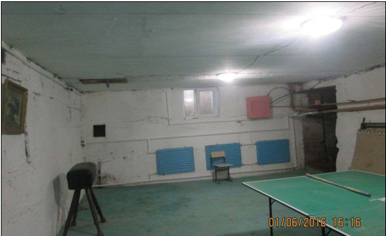
De gymzaal van de basisschool in Bichok

Maar door uw hulp komen er ook veel mooie dingen tot stand. Galya de verpleegkundige biedt waar nodig, nog steeds de noodzakelijke hulp.