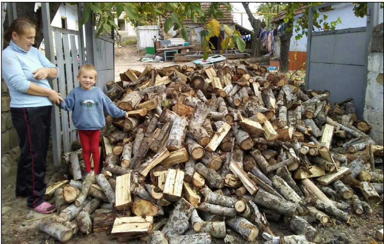
Stookhout voor de winter

U zult begrijpen dat er naast voedselproblemen, in dit armste landje van Europa, nog veel andere problemen zijn. Dankzij uw sponsoring kunnen wij er toe bijdragen het leven van veel mensen iets dragelijker te maken in dit landje, waar de zomers heet en droog zijn en de winters o zo koud.