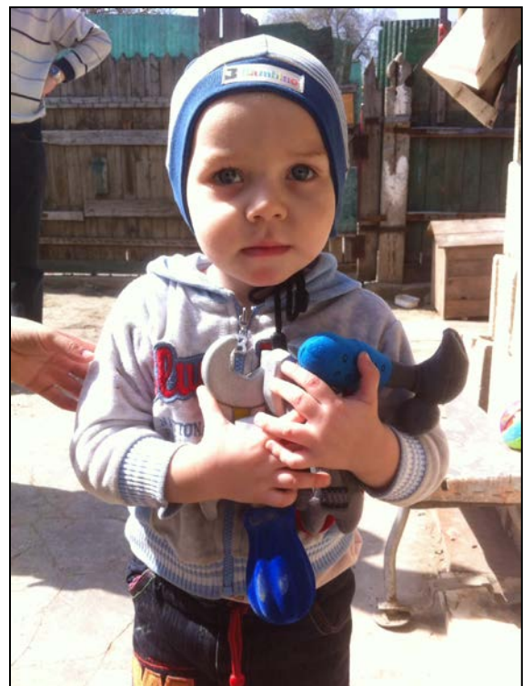
3-jarige houdt zijn verkregen speelgoed stevig vast

Ook de twee weeshuizen en het psychiatrisch ziekenhuis willen we zo mogelijk blijven steunen, alsmede enkele voor ons bekende arme gezinnen in de stad Tiraspol.