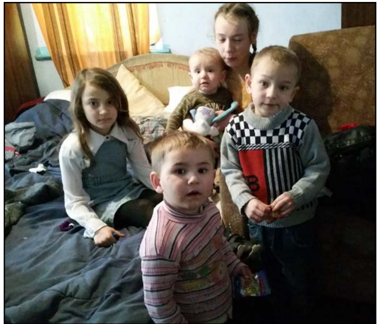
Ook deze vijf kinderen kregen een voedselpakket